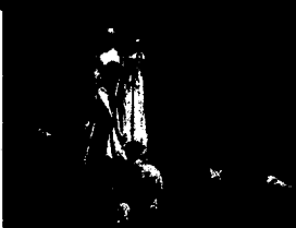
Ford Medox Brown Die lieben Lämmchen (1851–1856) Bildbetrachtung auf Seite 114 dieser Ausgabe