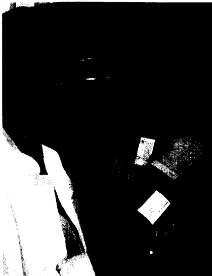
Die Allgemeinen Ortskrankenkassen wollen nun über regionale Sortimentverträge entgangene Einsparungen ausgleichen. Seite 6