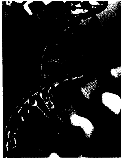
Die Mukoviszidose ist bislang nicht heilbar; eine frühzeitige Therapie kann die Progression jedoch entscheidend verzögern. Seite 16