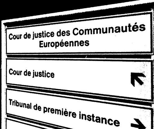
Der Europäische Gerichtshof beschäftigt sich in diesem Jahr wieder mit der Arzneimittelversorgung deutscher Krankenhäuser. Seite 6