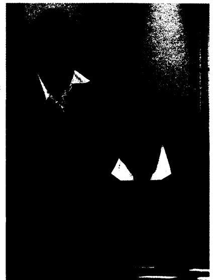
Anleitung zur Tastuntersuchung