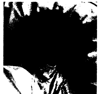
KANN MAN ZU ALT SEIN für eine Chemotherapie? Sollte das Alter ein Kriterium für die Therapieentscheidung sein?