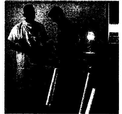
BEI FATIGUE ist Training ein probates Mittel. Es steigert die Leistungsfähigkeit, Schwächegefühl und Müdigkeit nehmen ab.