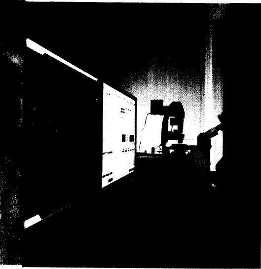
1998 gelang es erstmals, menschliche embryonale Stammzellen zu isolieren und zu kultivieren. Seite 30