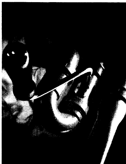
Was bringt den trägen Darm in Schwung? Neben Allgemein- und Verhaltensmaßnahmen sind mitunter Laxantien nötig. Seite 12