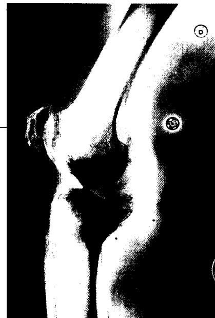
Positive Effekte einer Fußreflexzonen-Therapie bei Gonarthrose