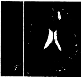
Chronisch progrediente Verlaufsform der Multiplen Sklerose.