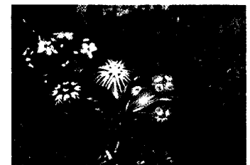
Ostergrüße und Osterbräuche Seite 127