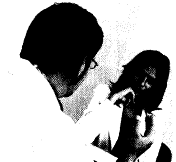
Individuelle Gesundheitsleistungen Seite 100