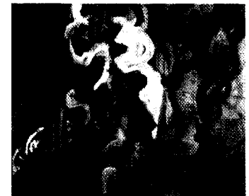
Ausstellung Franziska Kunath Seite 129