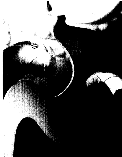
Magen-Darm-Probleme gehören zu den häufigsten Gesundheitsbeschwerden. Was ist bei der Selbstmedikation zu beachten? Seite 16