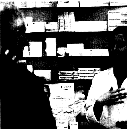
Diskussionen mit unzufriedenen Versicherten werden in den Apotheken seltener. Die AOK-Rabattverträge liegen vorerst auf Eis. Seite 6