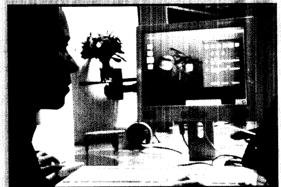
CAD-Modul als Einstieg