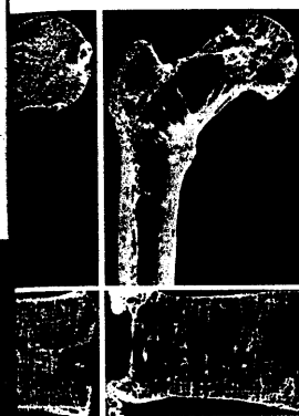
Unterschiedlich ausgeprägte Osteoporose am Beispiel des proximalen Femurausschnitts und des Lendenwirbelkörpers.