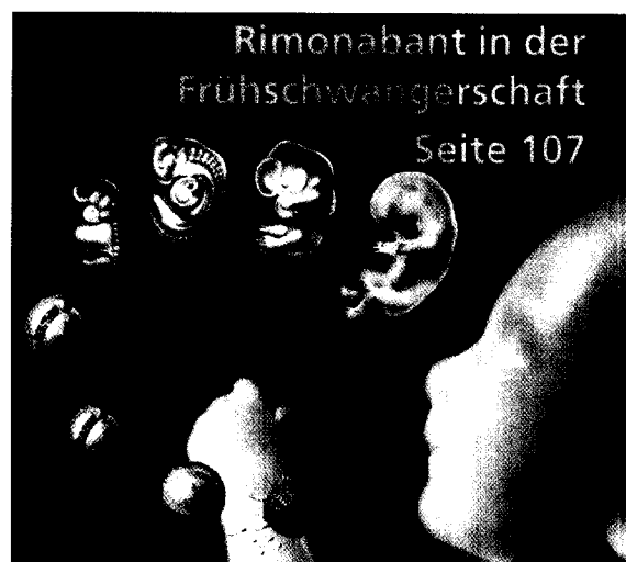
Rimonabant in der Frühschwangerschaft Seite 107

Wissenschaftliche Verlagsgesellschaft mbH Stuttgart Deutscher Apotheker Verlag Stuttgart