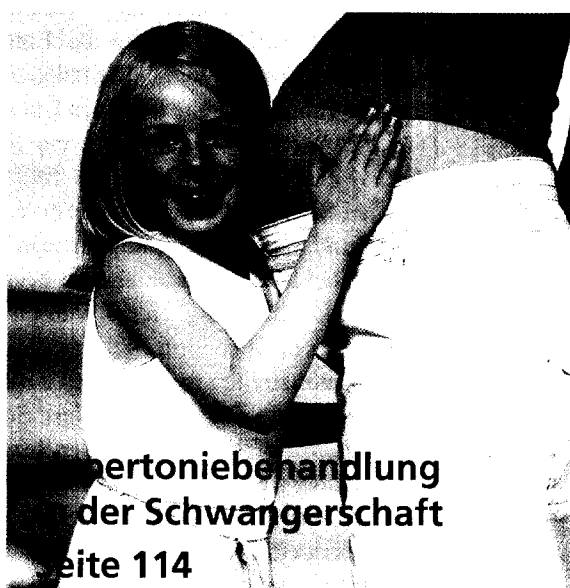
Hypertoniebehandlung der Schwangerschaft Seite 114