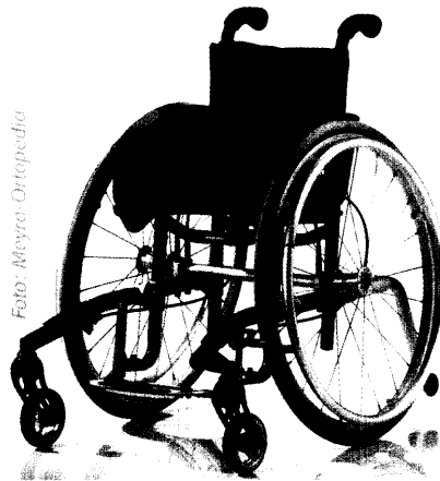
Flexibilität ist vor allem auch in der Kinder-Reha gefragt: Baukastensysteme, mitwachsende Sitzeinheiten und durchdachtes Zubehör lassen viele Anpassungsmöglichkeiten zu.