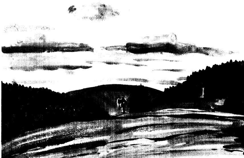
Mit Kunst Emotionen aufspüren und ausdrücken