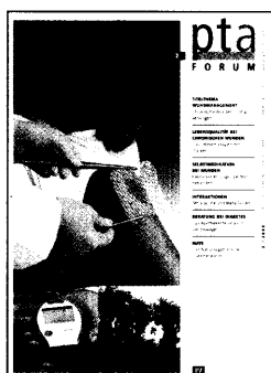
In dieser Ausgabe finden Sie das Supplement PTA-Forum 2/2008.

Arzneimitteltherapie ..... 36 Wie berechenbar sind Kinder?