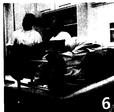
VORSORGE-KOLOSKOPIE: 80 Prozent der Karzinome werden damit bereits im Frühstadium entdeckt, bestätigen neue Daten.

Der Verlag haftet nicht für unverlangt eingesandte Manuskripte und Fotos.