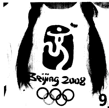
IMPFSCHUTZ: Welche Impfungen brauchen Ihre Patienten, die zu den Olympischen Spielen nach Peking reisen?