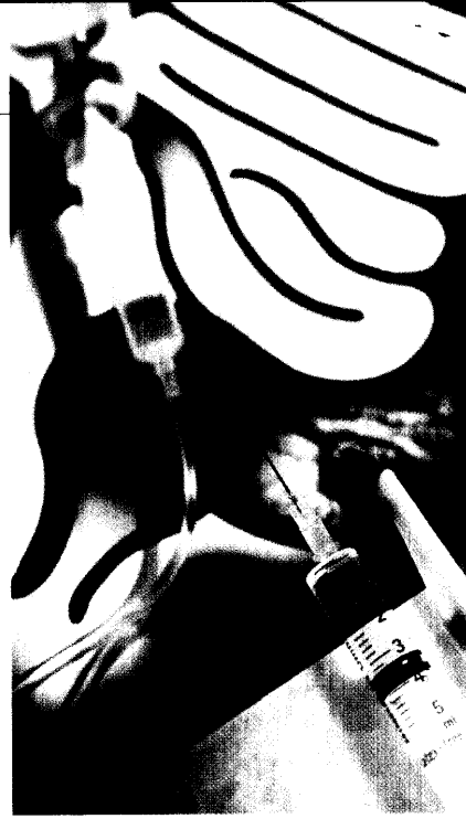
Der März ist auch im Jahr 2008 wieder dem Darmkrebs als Aktionsmonat gewidmet. Seite 14