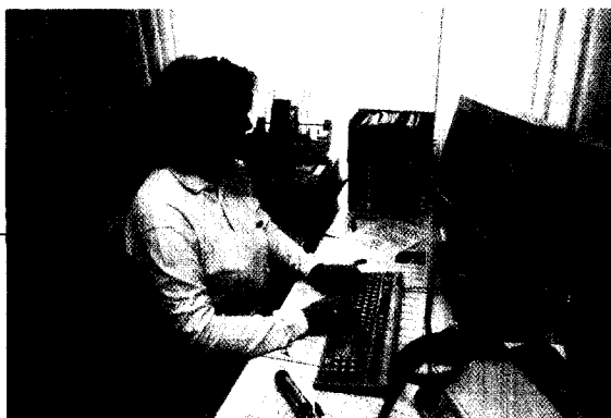
Der Ruf nach weniger Bürokratie verhallt ungehört, Rabattverträge schaffen neuen Frust