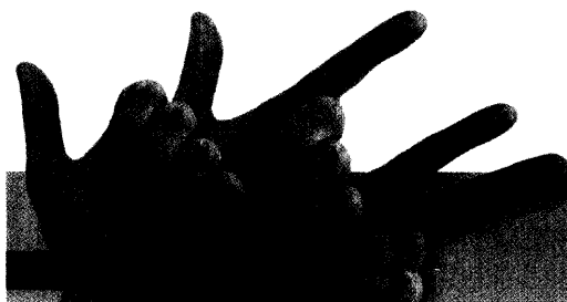
Zirkoniumdioxid – Empfehlungen aus der Praxis im Umgang mit einer besonderen Materialklasse.