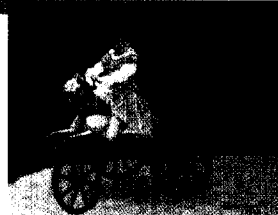
Claude Monet Jean Monet auf seinem Schaukelpferd (1872) Bildbetrachtung auf Seite 54 dieser Ausgabe