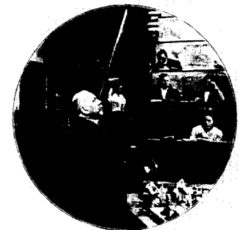
Die Lehrsammlung am Institut für Anatomie der Universität Leipzig Seite 79