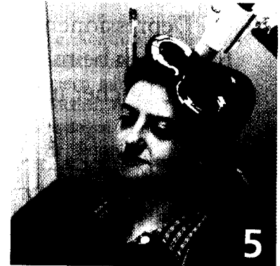
SCHWER DEPRESSIVEN PATIENTEN hilft offenbar die Therapie mit einer repetitiven transkraniellen Magnetstimulation.