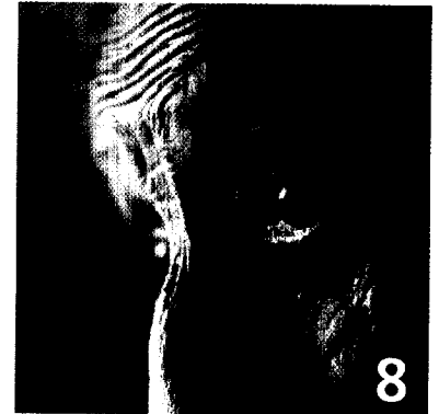
VERHALTENSSTÖRUNGEN bei Alzheimer-Patienten lassen sich auch mit Antidementiva vermindern.