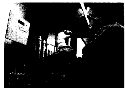
Künstliche Haut aus der Haarwurzel