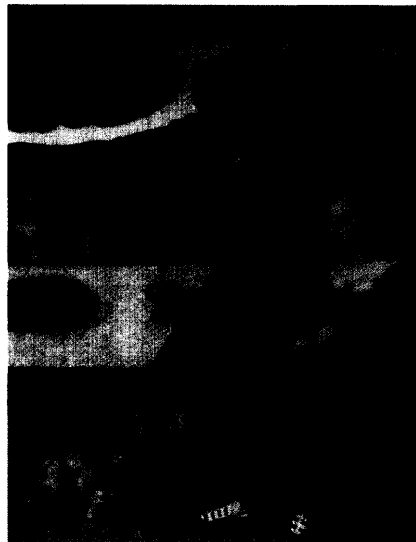
Künstler, Unternehmer, Apotheker: Lucas Cranach verstand es, Kunst und Kommerz zu verbinden. Seite 64