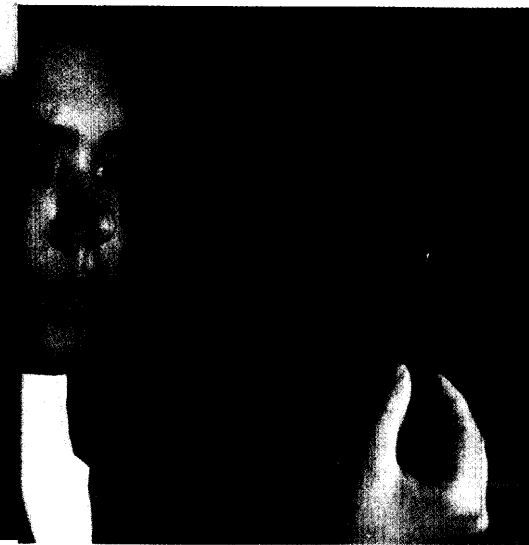
Mediziner sind auf neue Gene gestoßen, die an der Entstehung von Lupus erythematoses beteiligt sind. Seite 42