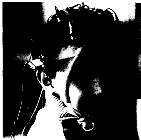
Ein neuer Arzneistoff im Januar ist Stiripentol, das bei Kindern mit einer seltenen Form der Epilepsie eingesetzt wird. Seite 28