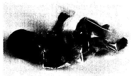
Die Auszeichnung innovativer Produkte unterstreicht die Bedeutung der Gesundheitswirtschaft für den Wirtschaftsstandort Deutschland.