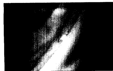
Gonioskopische Ansicht eines intrakanalikulären Mikro-Stents

... In Kombination mit der modernen ... Kataraktchirurgie weist die photoab- ... blative Trabekelchirurgie erhebliche ... konzeptionelle Vorteile gegenüber ... einer kombinierten Phako-Trabeku- ... lektomie auf. Prof. Thomas Dietlein ... vergleicht aktuelle Konzepte der ... Kammerwinkelchirurgie. Seite 14