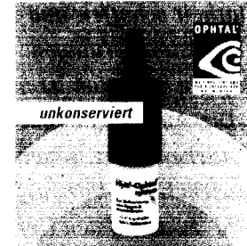
Hya ® -Ophthal ® system