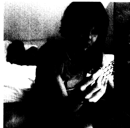
Manche Mädchen tun sich schwer mit dem Verhüten. Trotz der vielen Möglichkeiten werden viele Minderjährige schwanger. Seite 24