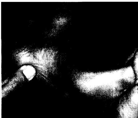
Bei einer Fasziiitis plantaris treten Schmerzen verstärkt durch eine Dorsalextension der Zehen auf Seite 68