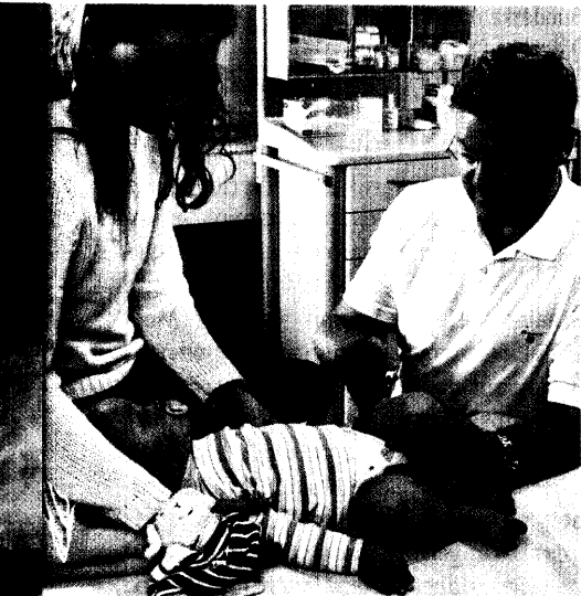
Ein neuer Meningokokken-Impfstoff hat sich in einer Phase-II-Studie bewährt. Er ist schon für Säuglinge geeignet. Seite 32