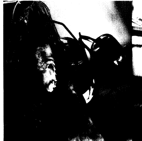
Im Dezember kamen zwei neue Arzneistoffe auf den Markt, die beide als Infusionslösung gegeben werden. Seite 24