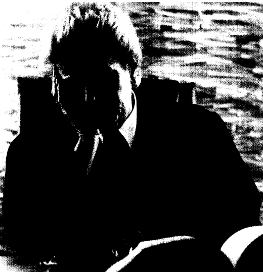
Verzweifelte Richter: Welche Gerichte sind für die AOK-Rabattverträge zuständig? Seite 6