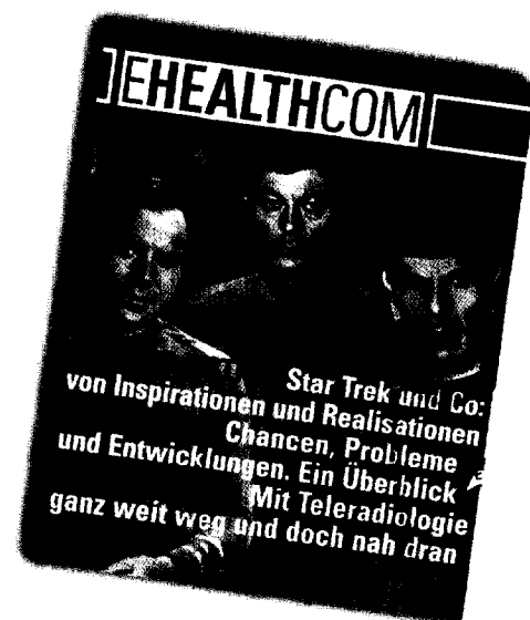
Ein starkes Doppel: Sonderheft zur eHealth week und Mai/Juni-Ausgabe von E-HEALTH-COM