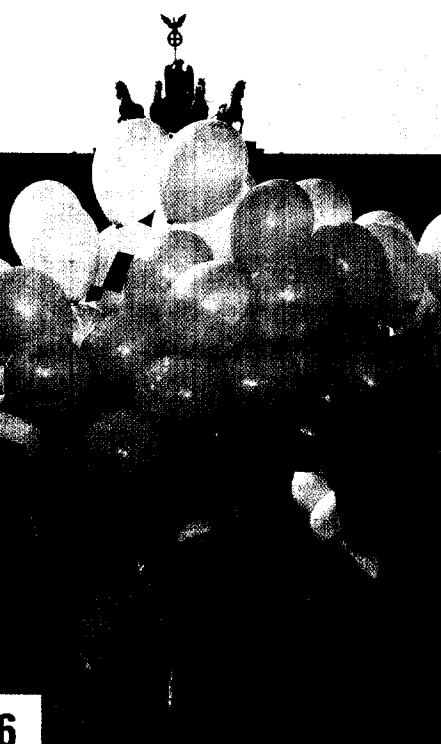
6 Europa wächst mehr und mehr zusammen. Auch in der vernetzten Medizin.