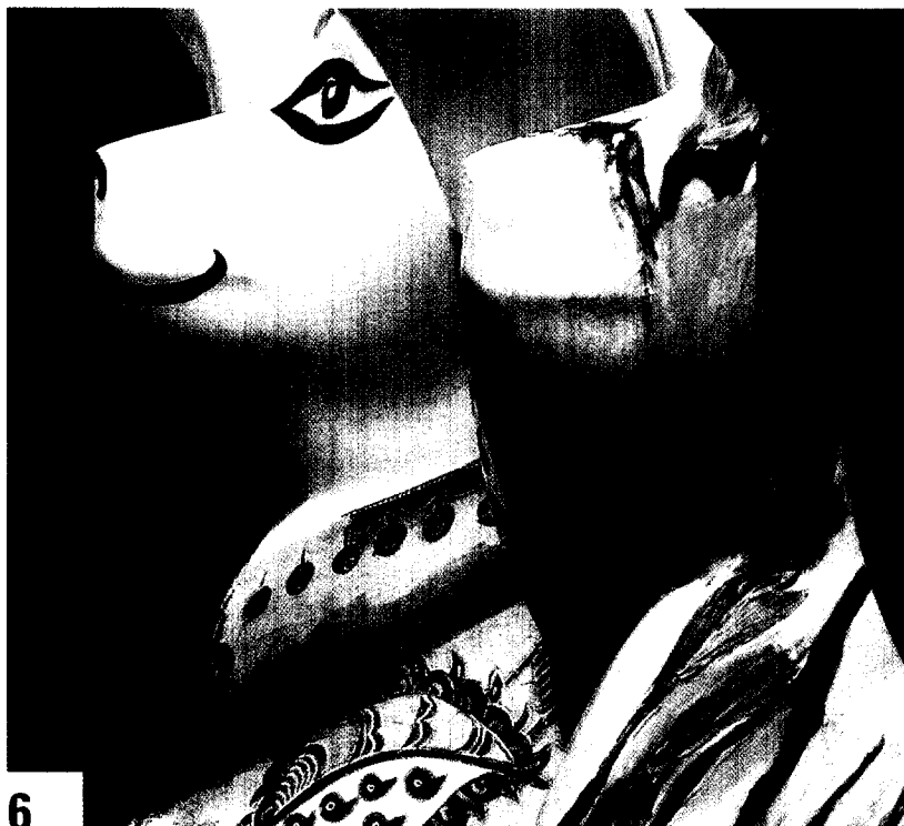
6 Nicht umsonst ist der Bär das Wahrzeichen Berlins. In der pulsierenden Metropole „tanzt der Bär“. Natürlich auch zur eHealth week.