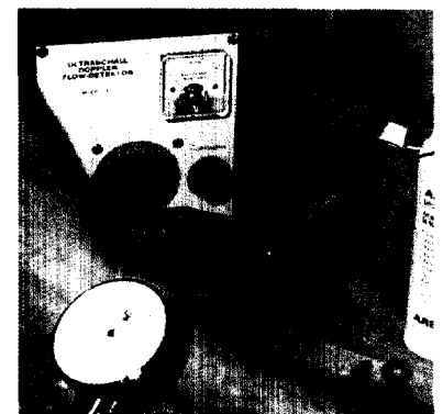
DURCH MESSUNG DES BLUTDRUCKS an Knöchel und Arm lassen sich Stenosen der Beinarterien erkennen.