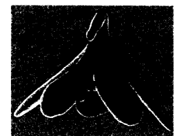
48_ Sildenafil beeinflusst den klitoralen Blutfluss