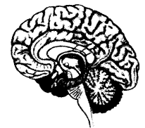
41_ Estrogeneffekte bei kognitiven Funktionen