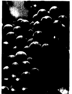
137_ Das französische Paradoxon