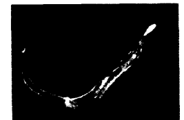
78_ Caenorhabditis elegans