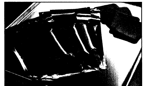
Schach dem Schock