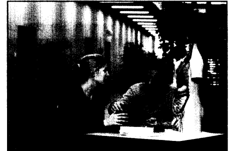
Berufspolitik: Blick über den Tellerrand