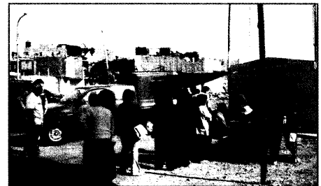
Ausland: Tagebuchnotizen eines Erdbebeneinsatzes in Peru