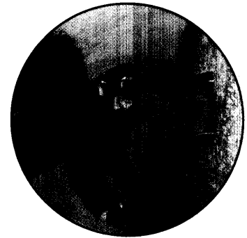
Begehbares Prostatamodell auf dem Infotag in Koblenz