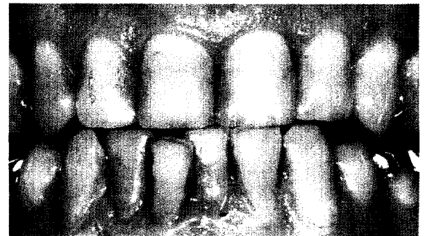
Adhäsiv befestigter, metallfreier Zahnersatz aus Feldspatkeramik Seite 78