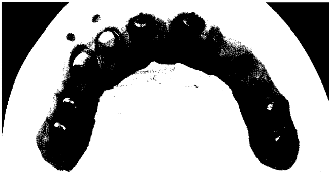
Verblockte Suprakonstruktion mit Passive-fit – Vorausschauend gestaltet Seite 68