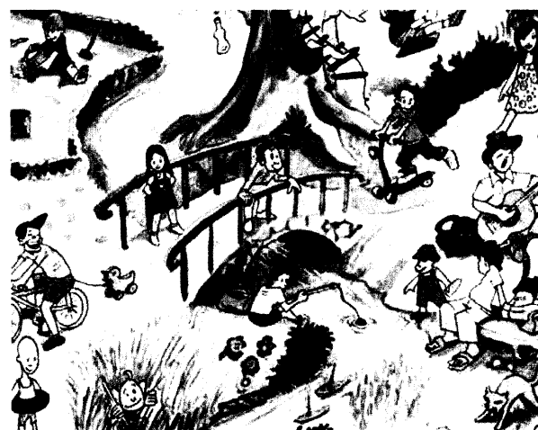
Der Augenkrieg 26