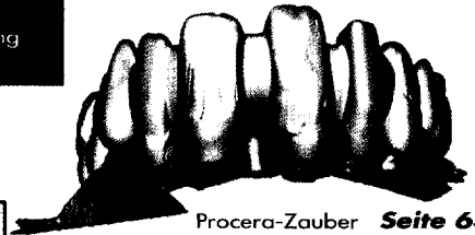
Procera-Zauber Seite 636