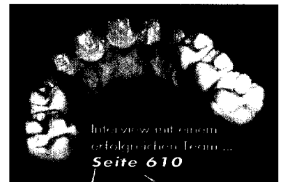
Interview mit einem erfolgreichen Team... Seite 610