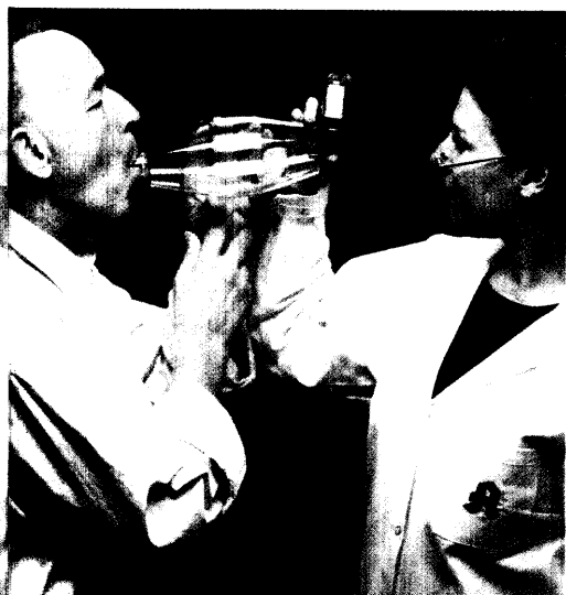
Wenn Apotheken auch künftig in der Hilfsmittelversorgung mitmischen wollen, sollten sie sich Kooperationspartner suchen. Seite 44