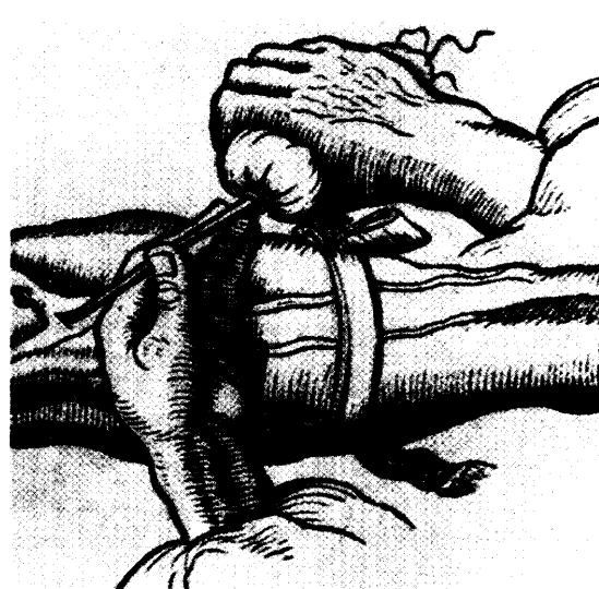
Bereiten den Patienten wohl einige Pein: Historische Injektionsgeräte, hier eines aus Federkiel und Tierblase. Seite 54