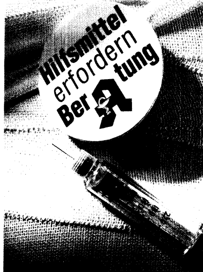
Schwerpunkt Hilfsmittel: Die Beiträge sind im Heft durch das Logo und im Inhalt durch / gekennzeichnet.