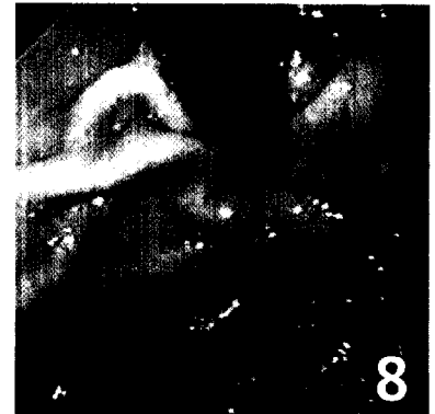
THERAPIEREFRAKTÄRER REFLUX: Mit dem Plicator™-Verfahren bessern sich die Symptome deutlich.