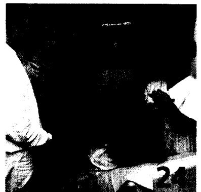
VARIZENBLUTUNG: Wird sie diagnostiziert, ist die Kombination Betablocker plus Ligatur eine effiziente Sekundärprophylaxe.