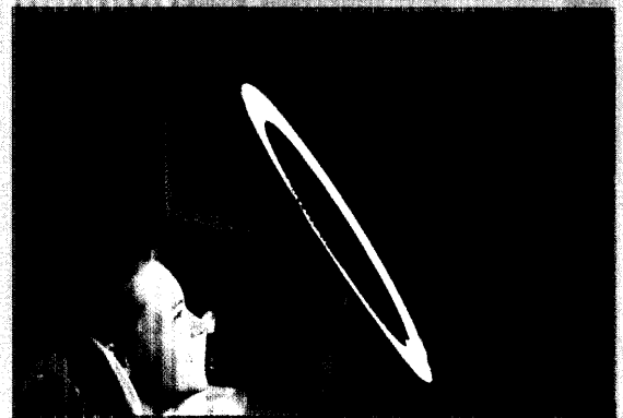
Zahntechnik im „Excellence-Center“