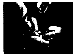
Abb. 3: Sechs Hände werden zur Augmentation benötigt