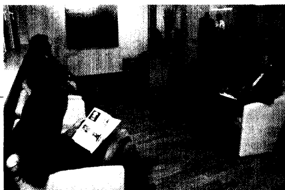
IGeL: ein Kompetenzzusweis für Ihre Praxis