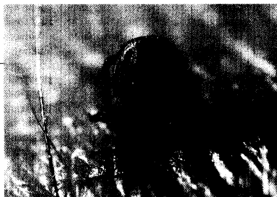
Schnelle Klärung nach Zeckenstich